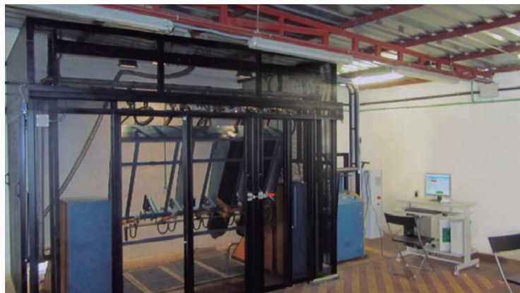
Sala de Retimbrados en Aguilera Extinción

Como usted conoce, deben realizarse revisiones especiales y retimbrados periódicamente o cuando se hayan descargado por haberse disparado la extinción, golpeado, etc.