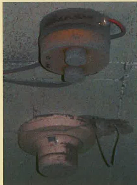
Es importante mentalizar al sector hotelero de la urgente necesidad de renovar sus equipos de PCI. (Imagen de un detector sucio).