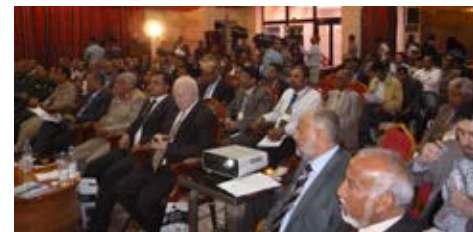
Asistentes a la I Conferencia del Impacto Económico sobre Seguridad y Protección a la izquierda los representantes del Gobierno Yemení.

El Grupo Aguilera cada día se encuentra más comprometido con la seguridad, es la base de nuestro trabajo. La intervención en conferencias como esta nos da la oportunidad de conocer las diferentes situaciones del sector en cada área geográfica y así, colaborar aportando nuestra experiencia para que poco a poco la seguridad contra incendios sea una realidad global.