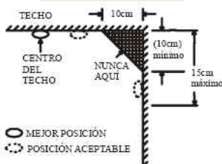
Figura 4: LUGARES RECOMENDADOS PARA LA INSTALACIÓN DE LOS DETECTORES DE HUMOS.