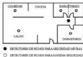
Figura 1: INSTALACIÓN DE LOS DETECTORES DE HUMOS EN VIVIENDAS UNIFAMILIARES CON UNA SOLA ZONA DE DORMITORIOS.