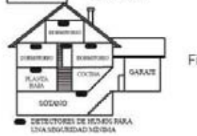
Figura 3: INSTALACIÓN DE LOS DETECTORES DE HUMOS EN RESIDENCIAS DE MÁS DE UNA PLANTA.